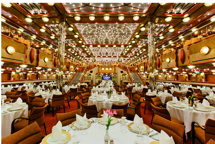
Abbildung ist nur repräsentativ.